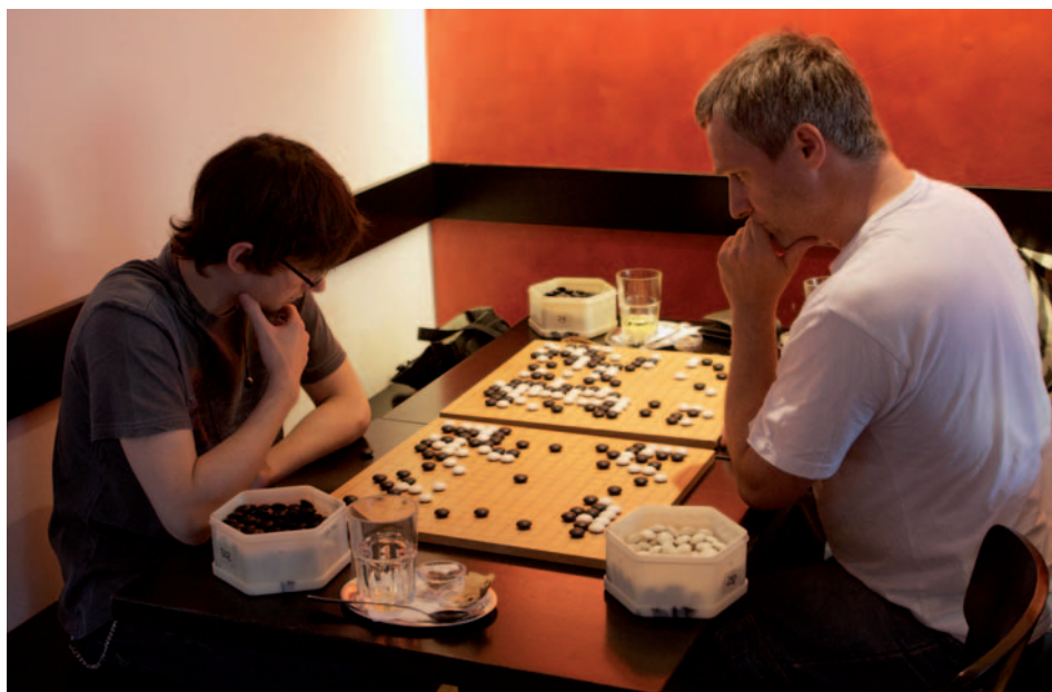
Zwei Winterthurer Spieler bei einer Partie Go am allwöchentlichen Spieleabend im Bistro Fahrenheit.

Der Go-Club Winterthur pflegt die Spielkultur des asiatischen Brettspiels Go im Raum Winterthur. Im November wird bereits zum elften Mal das jährliche Herbstturnier durchgeführt – eine gute Möglichkeit, das faszinierende Spiel kennenzulernen. Was es mit dem Spiel auf sich hat und was diesen Denksport so interessant macht, erfahren Sie in diesem Artikel.